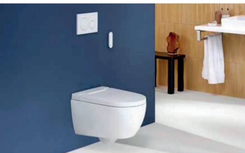
Alba ist das neueste Dusch-WC aus dem Hause Geberit.