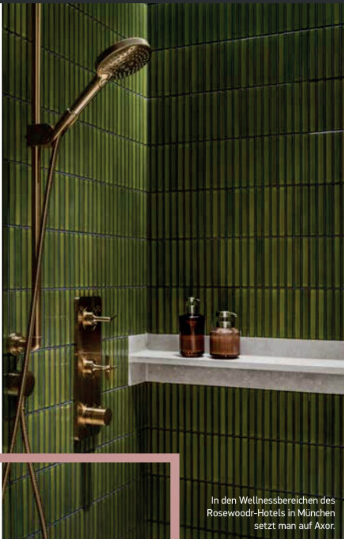
In den Wellnessbereichen des Rosewood-Hotels in München setzt man auf Axor.